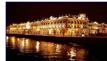
Vinterpalasset speiler seg i elven Neva.