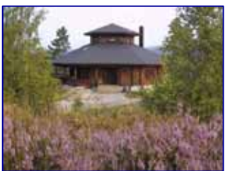
En del av Færnsnes Gjestegård.