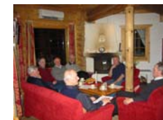
Fra et peismøte.