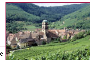
Alsace i Frankrike