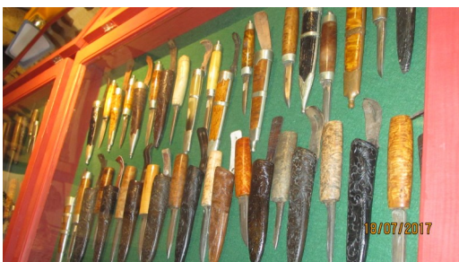
En fin og allsidig knivsamling.