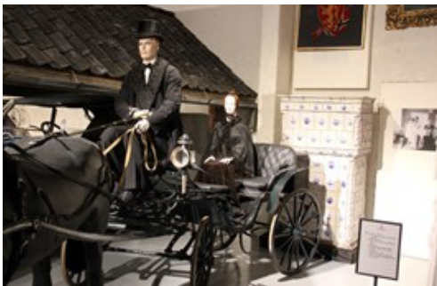
Og kontrasten. Hesteskys.