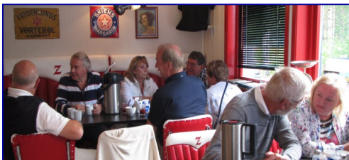
Og bevertning ble det også.