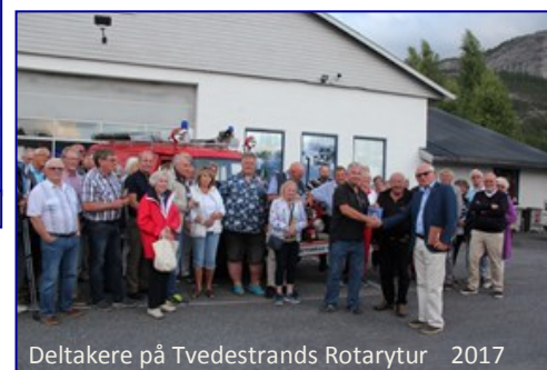
Deltakere på Tvedestrands Rotarytur 2017