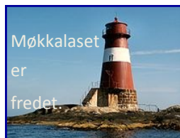
Møkkalaset er fredet.

som går i kystkulturen og havet utenfor Grimstad, Arendal og Tvedestrand. Området er moreneryggen som går langs kysten: I Tvedestrand er det Båen, - mens den i Grimstad strekker seg innover