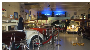
Bilavdelingen, noe for mimring.