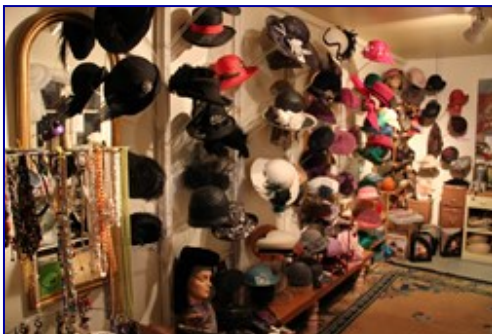
Og en stilig og flott hattesamling.