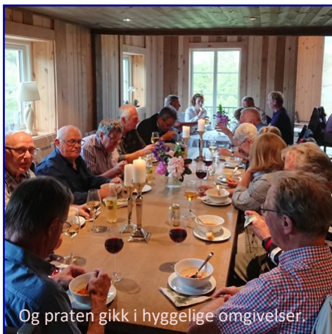
Og praten gikk i hyggelige omgivelser.

Dagens drift er vid og baserer seg på sel-