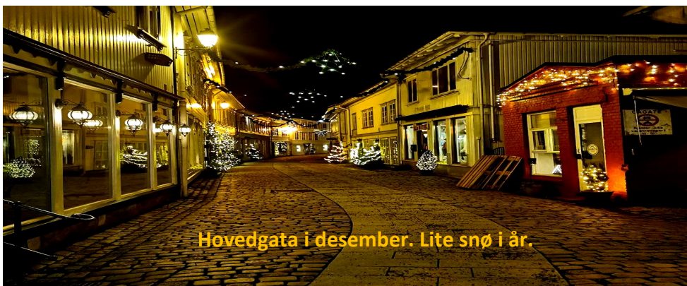
Hovedgata i desember. Lite snø i år.

Innledningsvis skrøt presidenten litt av klubben, hun trivdes stort og gledet seg til møtene. Presidenten skrøt av programmene, spennende bedriftsbesøk, gode aktiviteter og synes hun synes det var flott at vi også hadde ungdom med på Ryla.